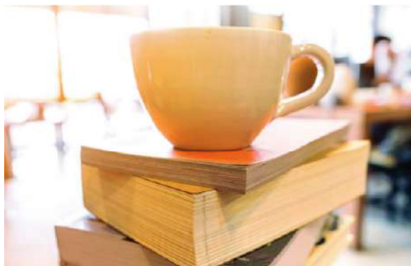
Lieto fine Il primo ospite di Librixia sarà Enrico Bertolino. La fiera dà spazio anche agli autori bresciani

Oliviero Toscani, Giovanni Allevi, Leonardo Caffo, Francesco Costa, Andrea De Carlo, Gianrico Carofiglio, Giovanni Floris, Marco Malvaldi, Beppe Severgnini, Rocco Tanica e Linus. Numerosa anche la rappresentanza degli scrittori bresciani, a testimonianza di una particolare vivacità letteraria all'ombra del Cidneo. A chiudere la rassegna Luca Bianchini con i suoi Baci da Polignano. Il programma è disponibile su librixia.eu , dove è possibile riservare i posti per partecipare agli incontri (l'ingresso è gratuito, ma la prenotazione è obbligatoria). Per chi non riuscisse ad accaparrarsi un posto c'è la possibilità di assistere agli incontri in streaming sui canali social di Librixia e del Comune. In programma anche laboratori alle biblioteche di San Polo e Prealpino e nel cortile del Broletto.