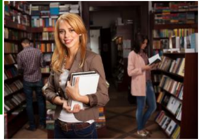
Una boccata di ossigeno dal Governo per biblioteche e librerie