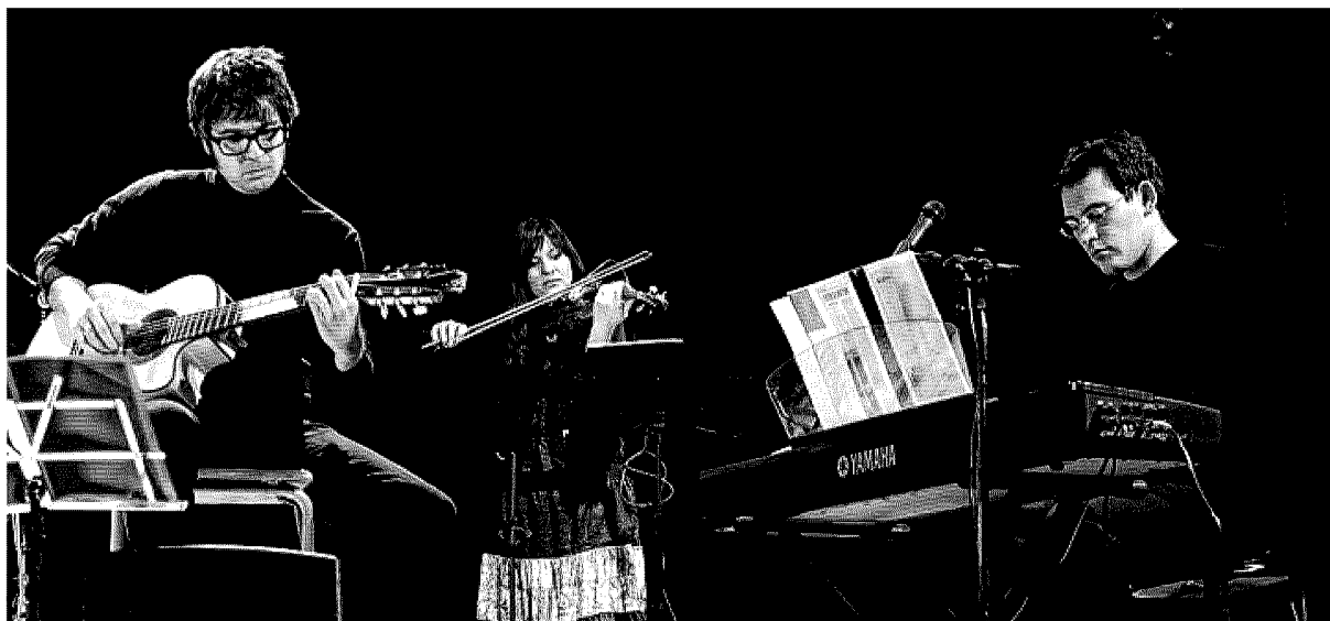
Il gruppo vocale e strumentale Klezmorim sarà all'auditorium Trombini per il Giorno della Memoria