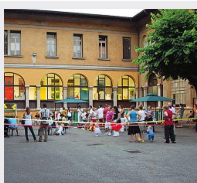
Condivisone Un'attività ludica per bambini nel cortile della fondazione

«Vinta» la sfida di sistemare in tempi record lo stadio Rigamonti. Certo, è stato il presidente Massimo Cellino a sborsare oltre 5 milioni di euro per assicurare una casa al Brescia di serie A ma il Comune (con la Prefettura in regia) ha comunque garantito i tempi dei bandi e delle scadenze, finanziando tra l'altro la sistemazione del parcheggio esterno (con contestuale demolizione della copertura mobile della vecchia piscina). Si sono fatti passi avanti anche sul fronte ambientale: a febbraio, come promesso, è stato riconsegnato alla città il parco di passo Gavia al quartiere Primo Maggio, chiuso da 18 anni per colpa dei veleni usciti dalla vicina Caffaro (anche se l'iter ha avuto un sequel giudiziario con l'azienda appaltatrice che chiede più soldi alla Loggia perché le bonifiche si sono rivelate più care del previsto). E sono iniziati