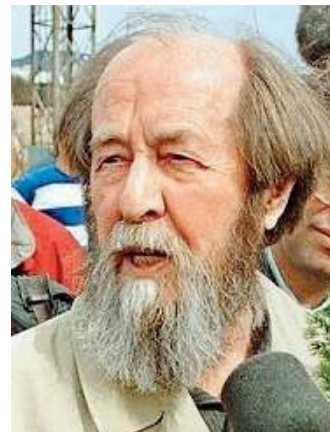
Dopo l'esilio. L'arrivo di Solženicyn

È impietoso nella sua analisi. La Russia ha scelto una via ipocrita per uscire dal comunismo: la nomenklatura occupa i posti di comando e l'oligarchia mette le mani sul potere e sulle ricchezze, mentre più di metà della popolazione precipita nella povertà. Europa e America incalzano una Russia senza più orgoglio. «Ritorno in Russia» è una scelta di discorsi e colloqui che segnano la tenace fede di Solženicyn nell'anima della sua patria. Vorrebbe che la Russia costruisse con pazienza la propria strada verso la democrazia, iniziando dall'elezione diretta delle amministrazioni locali, che puntasse ad un sistema che sappia «proteggere il popolo», e non copiasse l'Oc-