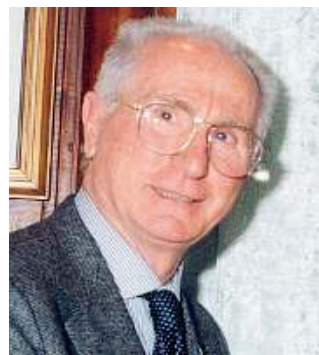
Azeglio Vicini. Calciatore e allenatore