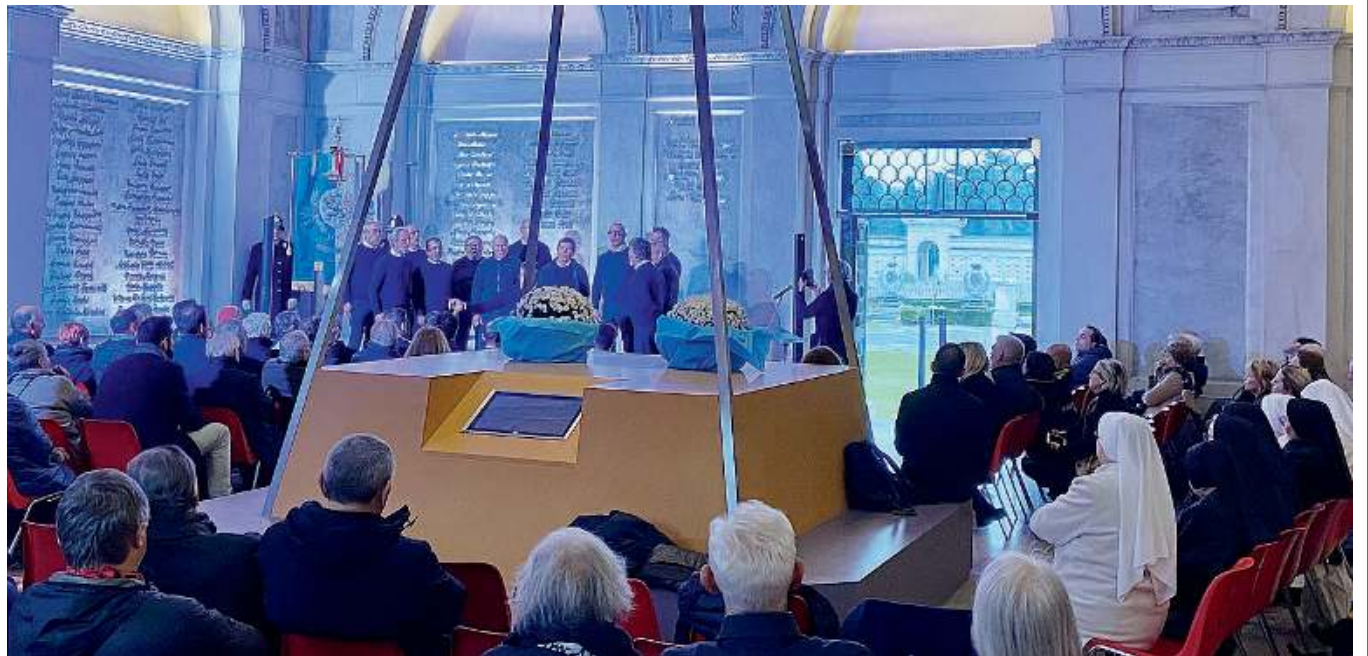
Nella «casa della fama». Un momento della cerimonia che si è svolta ieri pomeriggio al cimitero Vantiniano