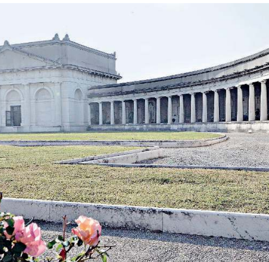
L'aula monumentale. Uno scorcio del Famedio nel cimitero di via Milano