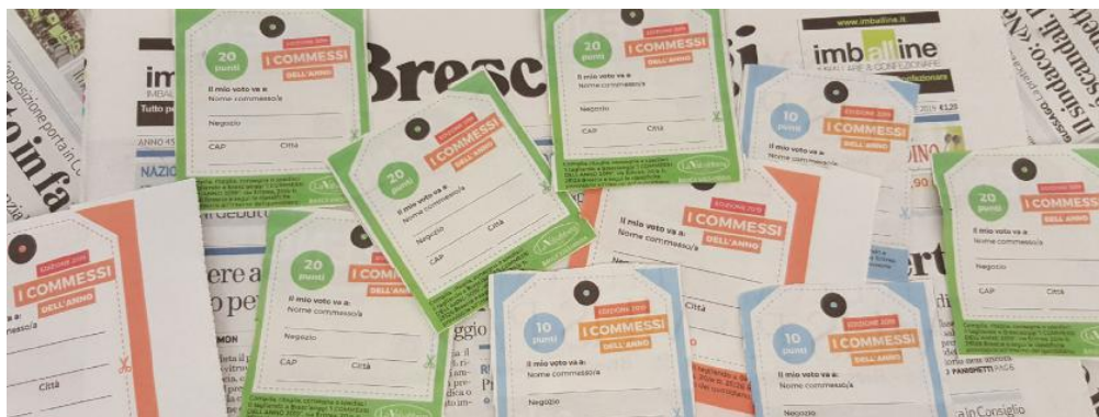
I colori dei tagliandi, quelli da un punto, da dieci e da venti: tra pochi giorni alla collezione si aggiungerà il super tagliando che vale ben cinquanta punti

SUCCESSIVAMENTE poi ci sarà anche la pubblicazione, per la seconda volta da quando il contest ha preso vita, delle classifiche. Va ricordato che le graduatorie pubblicate saranno due: quella assoluta, con il totale dei punti raccolti dallo scorso 13 settembre, giorno del primo tagliando in edicola; e quella parziale, ovvero solo quella riferita alla seconda fase del contest, dalla pubblicazione delle classifiche per la prima volta avvenuta esattamente una settimana fa. Le nuove classifiche saranno pubblicate venerdì, si conterranno i punti raccolti soltanto fino a mercoledì sera (solo per facilitare le operazioni, niente va perso) e ci saranno 200 punti bonus per chi sarà primo nella classifica parziale. •