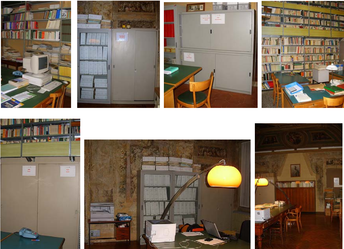
Su ogni armadio è stato posto un cartello che indica i fondi documentari in esso conservati.

Di ogni fondo si indicano brevemente alcune note informative intorno al soggetto produttore, quindi la consistenza documentaria, infine si riporta - in quasi tutti i casi - un elenco sommario dei fascicoli in modo da offrire delle prime coordinate per muoversi tra i documenti e renderli così fonti produttive di ricerca e studio, di pubblicazioni e convegni futuri.