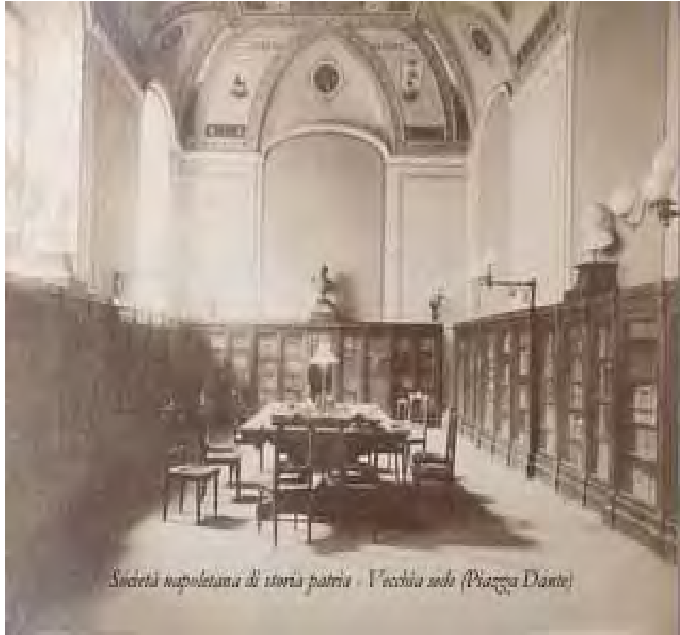
Società napoletana di storia patria - Vecchia sala (Piazza Dante)