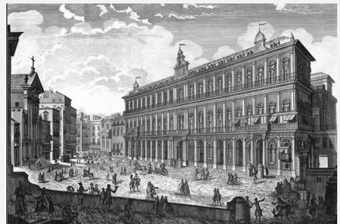
Palacio Real, Nápoles